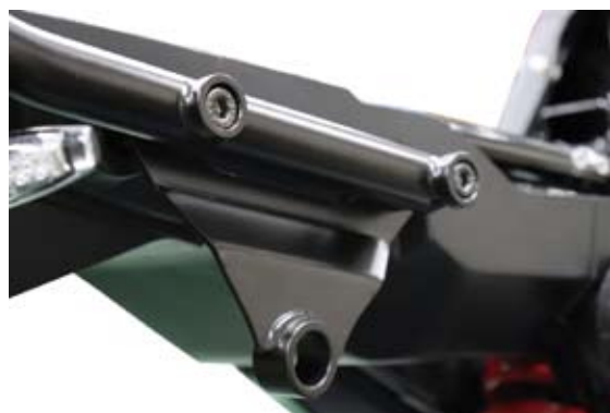
マフラー側に同梱のカラー