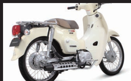
装着写真(スーパーカブ110/メッキプロテクター)