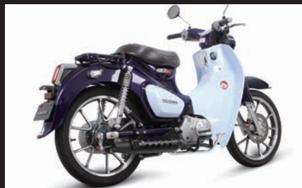
装着写真(ブラックプロテクター)