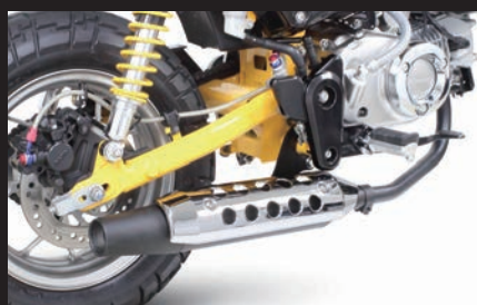
装着写真(メッキプロテクター)