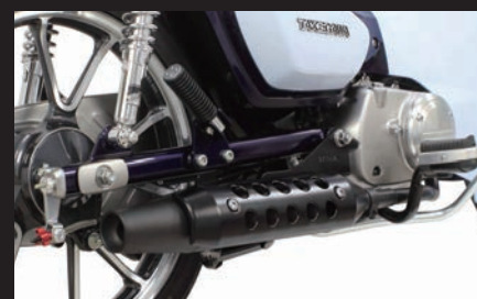
装着写真(ブラックプロテクター)