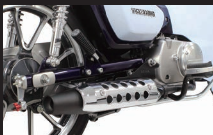
装着写真(メッキプロテクター)