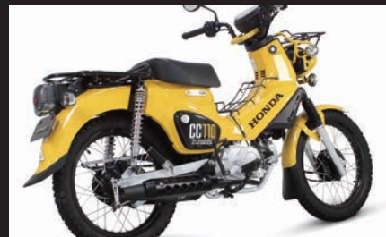
装着写真(クロスカブ110/ブラックプロテクター)