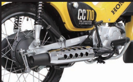
装着写真(クロスカブ110/メッキプロテクター)