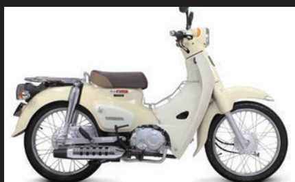
装着写真(スーパーカブ110/メッキプロテクター)