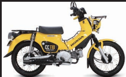
装着写真(クロスカブ110/ブラックプロテクター)

※スーパーカブ110はキックスターアームとマフラーが干渉する為、クロスカブ110用のキックスターアームと交換するか、セルスタートのみの対応となります。