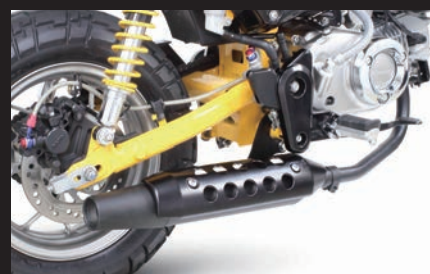
装着写真(ブラックプロテクター)