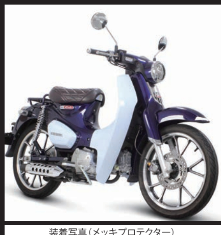
装着写真(メッキプロテクター)