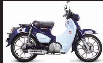
装着写真(メッキプロテクター)