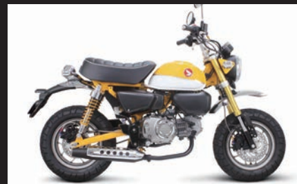
装着写真(メッキプロテクター)