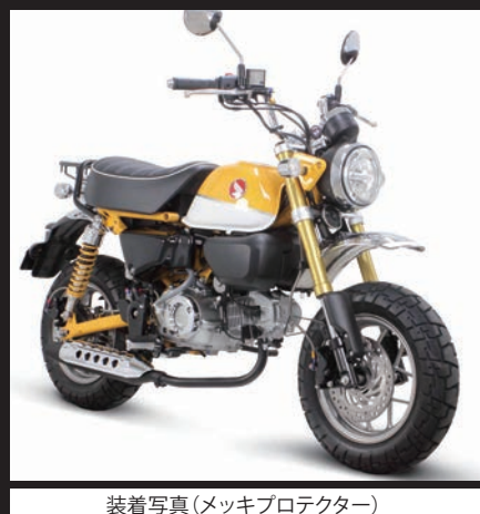
装着写真(メッキプロテクター)