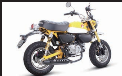
装着写真(ブラックプロテクター)