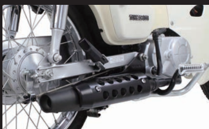
装着写真(スーパーカブ110/ブラックプロテクター)